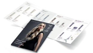
HUG Guest Leaflet CODE LIFHUG1