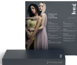
HUG Display da banco CODE ESP90