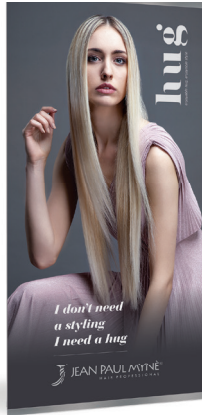
Interior HUG Taffetà CODE BAN235