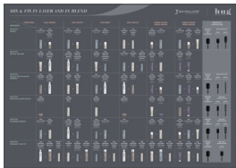
HUG Mix&Fix Poster CODE PHUG1