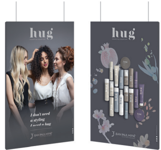
HUG Double Face Display