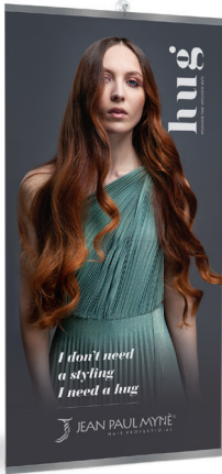
Interior HUG Taffetà CODE BAN234